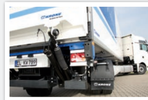
Extreme Wendigkeit. Die Zwangslenkung ist eine bewährte Einstangenanlage, die im Fahrgestell verschraubt ist und wartungsarm funktioniert. Der Lenkwinkel von 25° erlaubt Fahrmanöver auf engstem Raum.