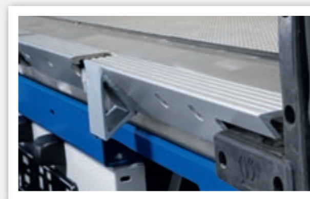
Aluminium-Anfahrkeil. Ein Aluminium-Anfahrkeil gehört zur Serie bei der Ausstattung mit einer Ladebordwand. Der Anfahrkeil schließt die Lücke zwischen Ladefläche und Plattform.