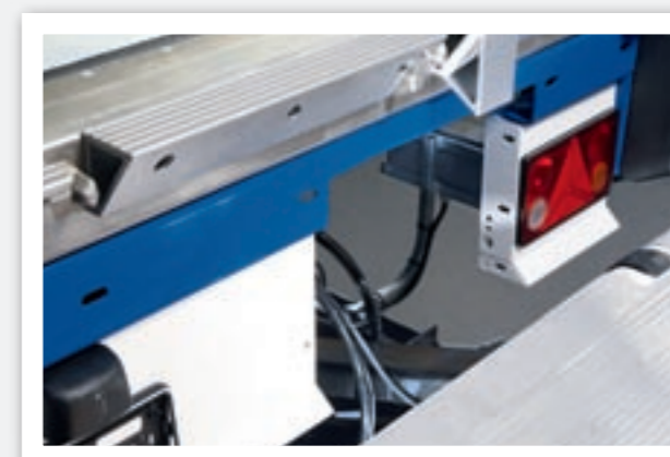
Ladebordwandvorbereitung. Bei der Ladebordwandausstattung verfügt sowohl das Chassis als auch der Beleuchtungsträger über einen Ausschnitt, passend für die Hubarme der Ladebordwand.