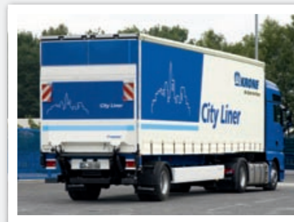
Kurzes Chassis. Der City Liner ist flexibler und wendiger als jeder Solo-LKW.

währte KRONE Qualität: Je nach Einsatz erhalten Sie ihn mit sämtlichen Aufbauvarianten vom Kühler über Trockenfracht bis hin zur Schiebegardine oder dem klassischen Bordwandfahrzeug. Und dabei ist er flexibel einsetzbar mit einer Standard-Zugmaschine und wendiger als jeder Solo-LKW mit gleicher Ladelänge.